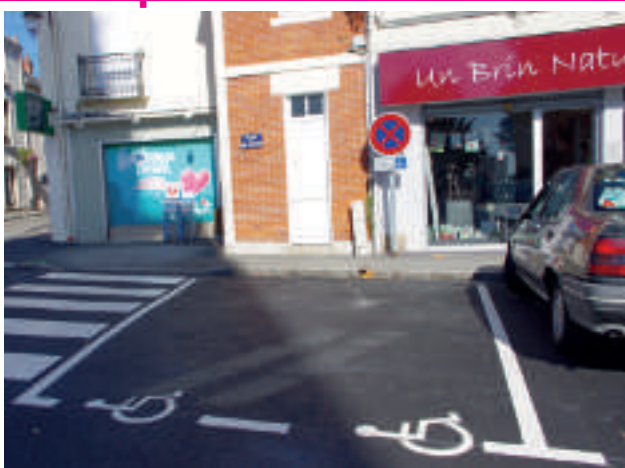
L'emplacement réservé sur la place de l'Eglise est mieux identifié. Merci aux valides de ne pas l'utiliser même pour "une petite minute".