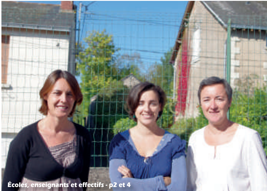
Écoles, enseignants et effectifs - p2 et 4