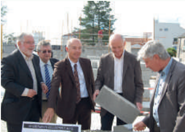
Pose de la "première pierre" place de l'Eglise avec La Nantaise d'Habitations, en présence du député, du conseiller général et du maire