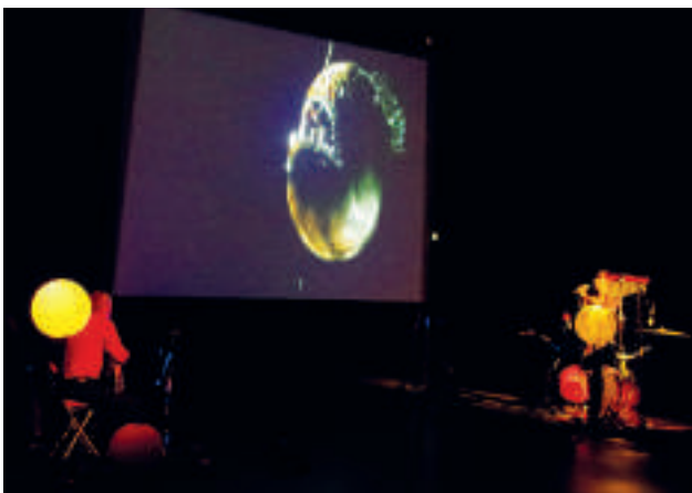
Le duo a travaillé à la mise en scène d'Abysses, un documentaire-concert, et l'a présenté au public à la fin de sa résidence.