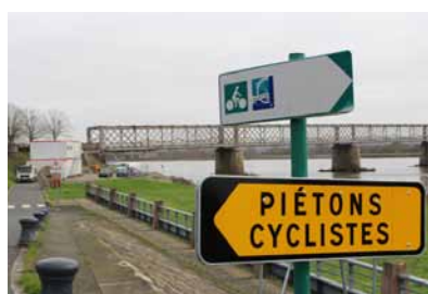
P.6 Travaux sur les ponts de Mauves