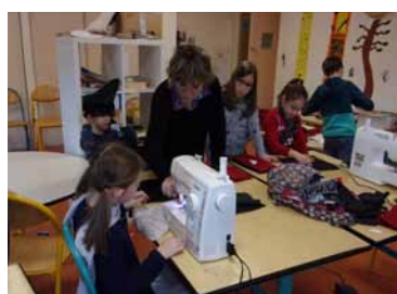
P.6 L'ALSH du mercredi après-midi