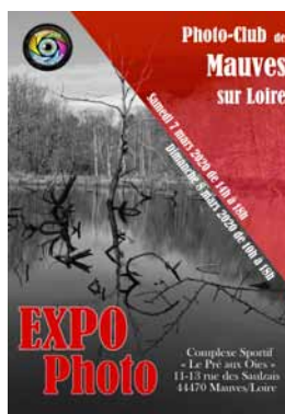
PHOTO CLUB DE MAUVES

Le Photo-Club de Mauves-sur-Loire présentera son exposition annuelle le samedi 7 mars de 14h à 18h et le dimanche 8 mars de 10h à 18h dans la salle René-Guy Cadou au Pré aux Oies.