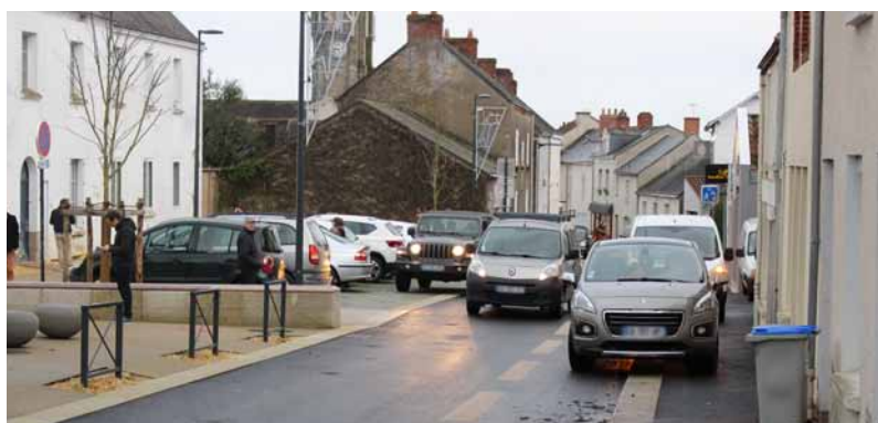
La rue est étroite lorsque des véhicules stationnent de part et d'autre de la chaussée. 135 € pour le contrevenant.