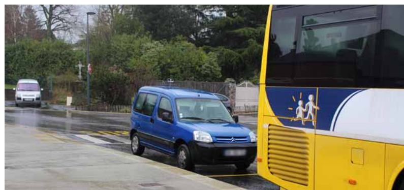
Le car suivant devra trouver une autre place ou alors bloquer la circulation en attendant que la voiture s'en aille. 35 € d'amende !