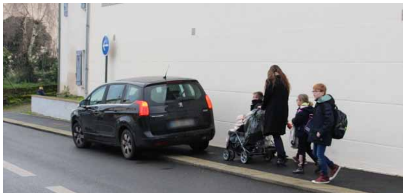
Les enfants et les parents avec leur poussette patienteront avant de pouvoir circuler sur le trottoir. Coût de l'amende : 135 €.