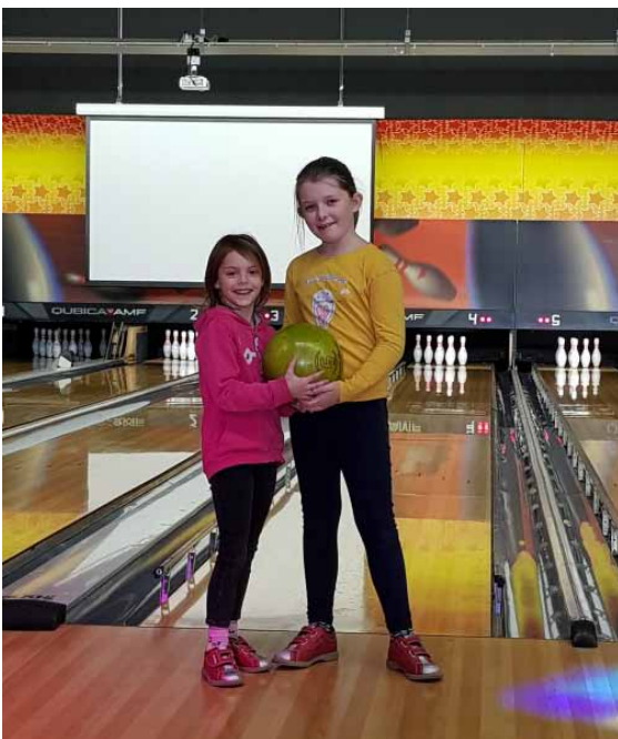
Sortie bowling, organisée par les enfants, le 18 décembre dernier.

+ d'infos : Accueil de la mairie ; 02 40 25 50 36 mairie. mauves@mauveysurloire.fr