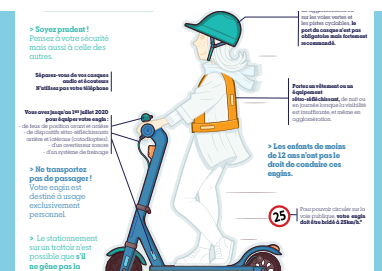
P.3 Les trottinettes électriques