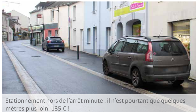
Stationnement hors de l'arrêt minute : il n'est pourtant que quelques mètres plus loin. 135 € !