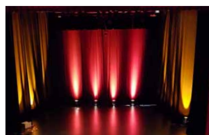
P.7 Les spectacles au Vallon