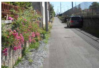
P.3 Ma rue en fleurs