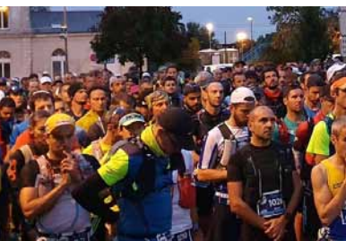
P.4-5 Grands événements associatifs