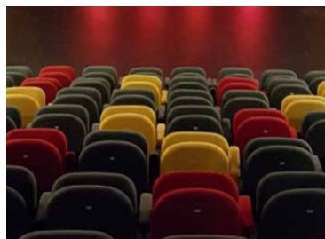
P.7 Les spectacles au Vallon