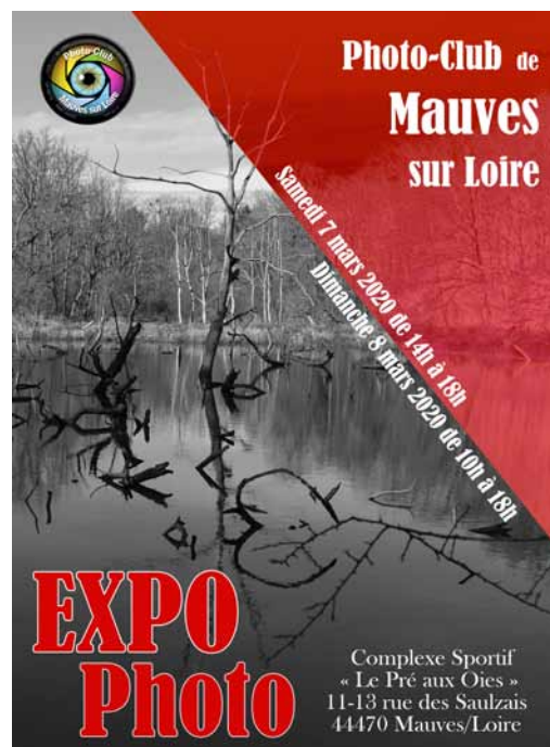
PHOTO CLUB DE MAUVES

Le Photo-Club de Mauves-sur-Loire présentera son exposition annuelle le samedi 7 mars de 14h à 18h et le dimanche 8 mars de 10h à 18h dans la salle René-Guy Cadou au Pré aux Oies.