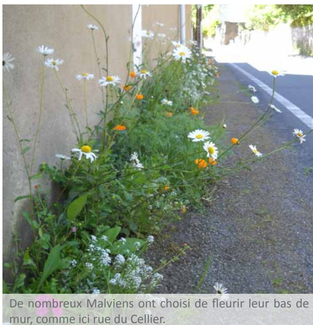
De nombreux Malviens ont choisi de fleurir leur bas de mur, comme ici rue du Cellier.

Mauves-sur-Loire propose aux habitants de fleurir leur quotidien en participant à l'opération Ma rue en fleurs .