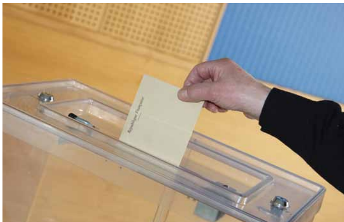
Les élections municipales se déroulent les 15 et 22 mars.