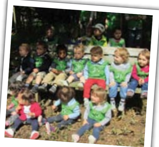
Les enfants et assistantes maternelles de l'association les Bouts d'chou malviens ont fait leur sortie de fin d'année le 28 juin au parc animalier Natural Parc à Saint-Laurent-des-Autels.