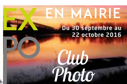
P9. Expo photo