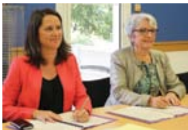
P5. Contrat de co-développement