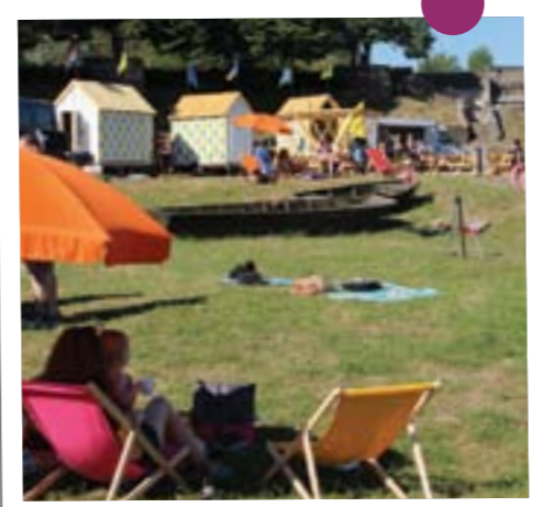
Tout l'été, Malviens, cyclotouristes et passants ont pu profiter de Mauves Balnéaire , une installation inscrite dans le cadre du Voyage à Nantes qui proposait de nombreuses animations.