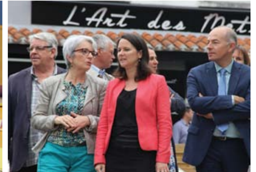
Une déambulation dans la commune a permis de rendre compte des différentes réalisations qui ont eu lieu au travers des contrats de co-développement.

Le 4 juillet, la commune de Mauves-sur-Loire a été la première à signer avec Nantes Métropole le contrat de co-développement, un document qui définit les politiques publiques métropolitaines et municipales pour la période 2016-2020 ainsi que les modalités de mise en application.