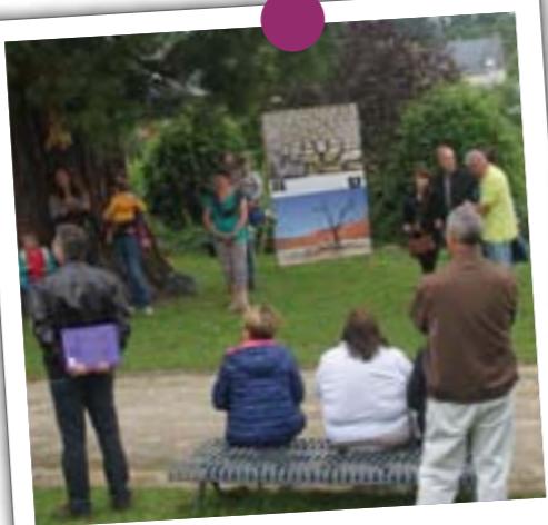
Le 1 er juillet avait lieu le vernissage de l' expo de l'été sur le thème Ambiances climatiques. 30 photos, proposées par des amateurs, étaient exposées dans la commune.