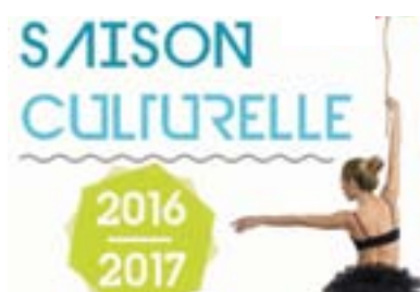
P7. Les spectacles de la saison