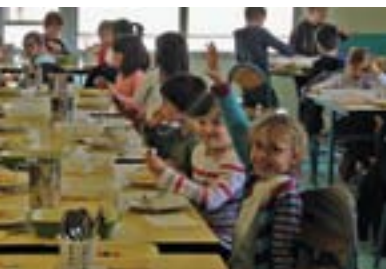
P4. Enfance/Jeunesse : les nouveautés