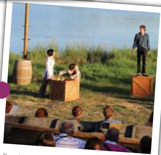
Dans le cadre de Mauves Balnéaire, la compagnie Parole en l'Air est venue jouer sa pièce de théâtre la Loire à Livre Ouvert dans un décor naturel et parfaitement adapté : les bords de Loire.