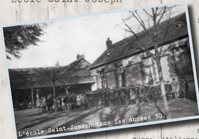
L'école Saint-Joseph dans les années 30.

En 1959, l'école privée se compose de l'école Notre-Dame pour les filles avec une classe enfantine et trois classes primaires, et de l'école Saint-Joseph pour les garçons avec trois classes.