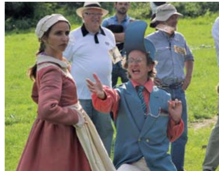
Pour les Journées du Patrimoine 2015, la compagnie Bel Viaggio avait joué un spectacle original sur le quartier du port qui était à l'honneur cette année-là.

Les Journées Européennes du Patrimoine se déroulent les 17 et 18 septembre. Un spectacle déambulatoire est organisé le 18 septembre dans les rues du bourg.