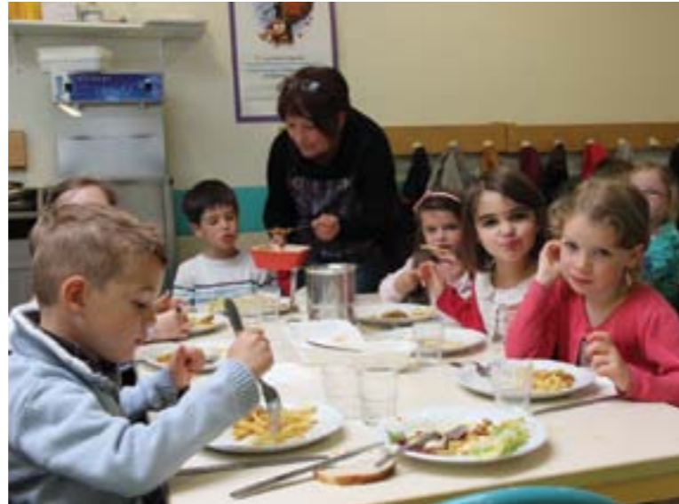
Le coût d'un repas à la restauration scolaire baisse de 20 centimes.

Le service enfance/jeunesse propose désormais un portail familles pour faciliter les démarches des parents. Cette nouveauté s'accompagne d'une modification du mode de calcul des tarifs.