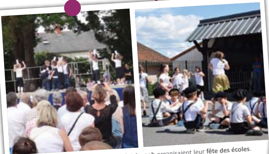
Le 25 juin, les écoles Jules Verne et Saint-Joseph organisaient leur fête des écoles . L'occasion de proposer des spectacles pour le plus grand plaisir des parents.