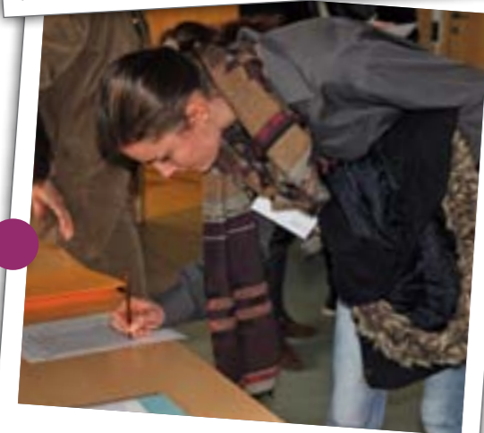
Le 28 novembre, les élus ont accueilli les jeunes inscrits sur les listes électorales . L'occasion de leur remettre l'outil adéquat : la carte de vote.