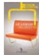
Le liseur du 6h27