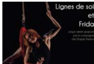
P9. Spectacle Draps Aériens