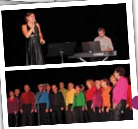
Le 12 décembre le public était nombreux au Vallon pour le concert de la chorale Thouré-mi-fa-sol et Fedora Rose Trio .