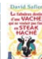
Le fabuleux destin d'une vache qui ne voulait pas finir en steak haché