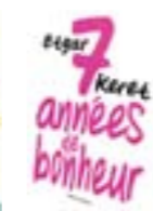
7 années de bonheur