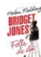
Bridget Jones : Folle de lui