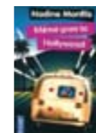
Mémé goes to Hollywood