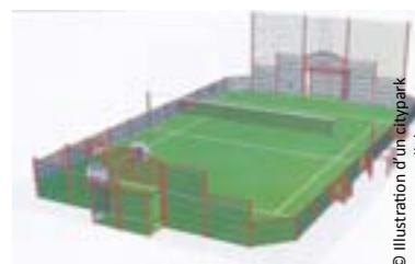
© Illustration d'un citypark (non contractuelle)

Le coût total pour la réalisation de ce projet est de 100 145 €. Les travaux seront menés par l'entreprise ART-DAN. Le chantier débutera à la mi-janvier pour se terminer mi-février. La livraison des équipements est cependant soumise aux aléas météorologiques notamment en raison de la pose d'un sol synthétique sur le citypark.