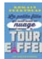
La petite fille qui avait avalé un nuage grand comme la tour Eiffel