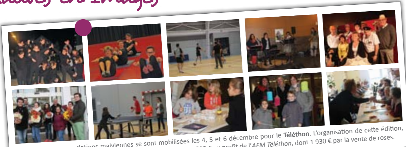
De nombreuses associations malviennes se sont mobilisées les 4, 5 et 6 décembre pour le Téléthon . L'organisation de cette édition, pilotée par 3D Événements et la mairie, a permis de récolter 6 588 € au profit de l' AFM Téléthon , dont 1 930 € par la vente de roses.