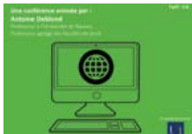
P9. Conférence au Vallon