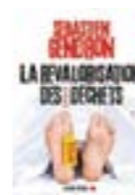
La revalorisation des déchets