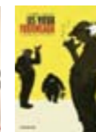
Les vieux fourneaux