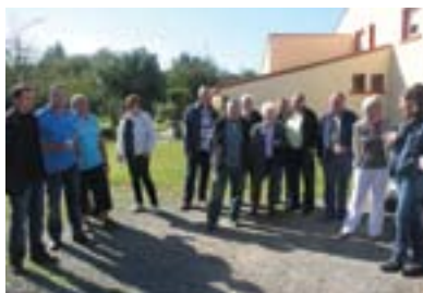
P6. Rencontre population