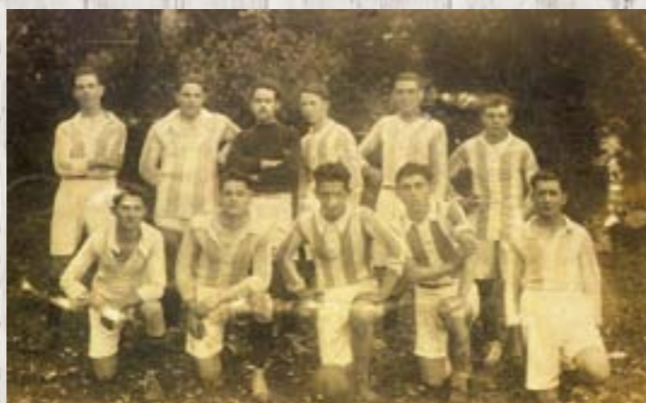
La 1 ère équipe de football de Mauves, en 1926.