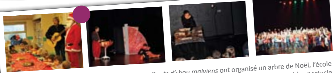
Chacun a fêté Noël à sa façon en décembre. Les Bouts d'chou malviens ont organisé un arbre de Noël, l'école Jules Verne a assisté au spectacle Histoires de papier , le relais assistantes maternelles a proposé le spectacle Mademoiselle Musaraigne et enfin les enfants de l'école Saint-Joseph ont chanté sur la scène du Vallon.