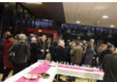
P6. Vœux aux habitants