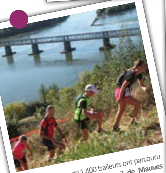
Le 2 octobre, plus de 1 400 traileurs ont parcouru la commune à l'occasion du trail de Mauves en Vert , course incontournable de la Loire-Atlantique.