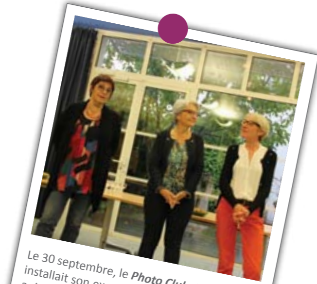
Le 30 septembre, le Photo Club de Mauves installait son expo en mairie. Le vernissage a été l'occasion de saluer le travail réalisé par les membres de l'association.