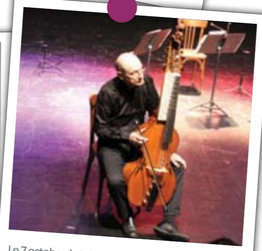
Le 7 octobre, la Mission Baroque de la Soufflerie de Rezé a fait revivre le compositeur Haydn au Vallon en proposant spectacle et conférence avec des instruments anciens restaurés.