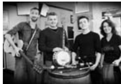
P.8. Musique irlandaise au Vallon