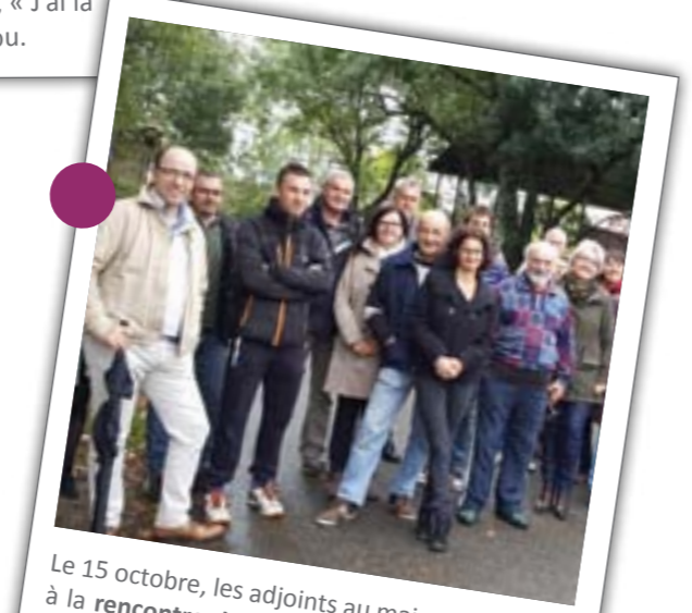
Le 15 octobre, les adjoints au maire sont allés à la rencontre des habitants du village de la Drutière. L'occasion d'échanger sur les actions municipales.