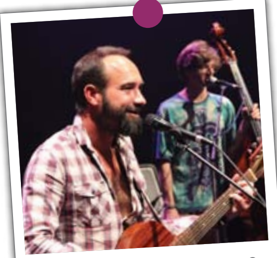
Le 28 septembre, le chanteur RIMO , accompagné de ses deux musiciens, a lancé la saison culturelle au Vallon pour un spectacle très animé.