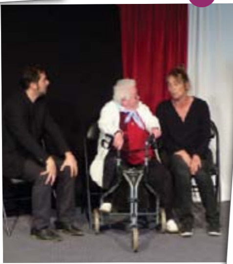
Le 3 octobre, durant la Semaine Bleue plusieurs personnes âgées de Mauves-sur-Loire ont pu bénéficier d'un transport gratuit proposé par les membres du CCAS pour assister à un spectacle offert, « J'ai la mémoire qui flanche », à Carquefou.