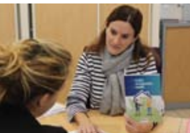
P.4-5. Logements sociaux