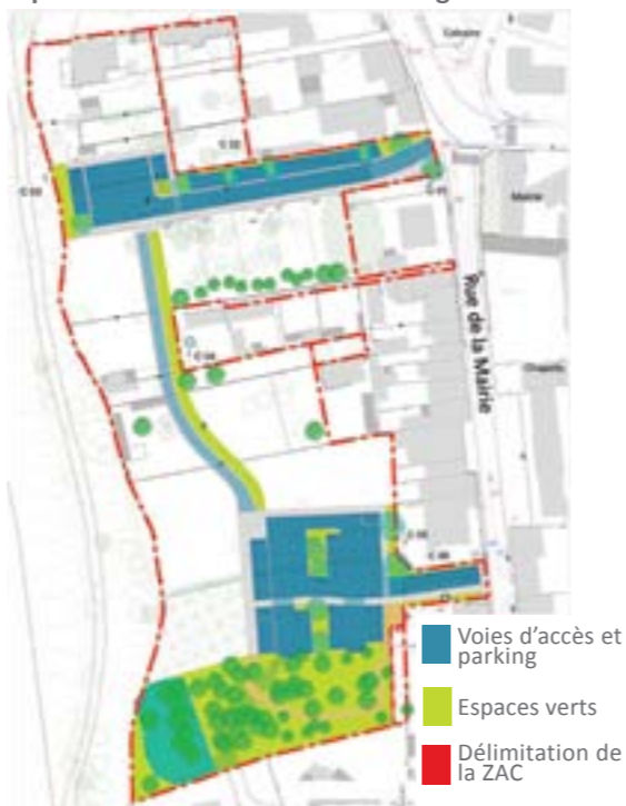
Le projet de ZAC du centre bourg

Les logements sociaux sont attribués par une Commission d'Attribution des Logements , animée par chaque bailleur et au sein de laquelle siègent entre autres le Maire et un représentant de Nantes Métropole. Cette commission s'assure de la compatibilité entre les logements proposés, la demande des candidats, leurs ressources et composition familiale.