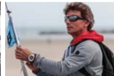
P.9. Conférence : Vendée Globe