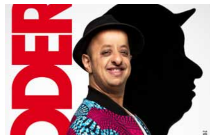
P10. Festival Mauves de Rire