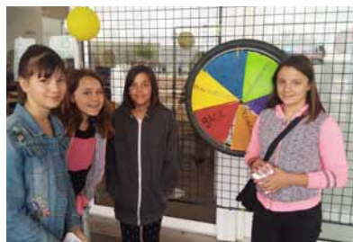
P.8 L'action vélo pour les collégiens