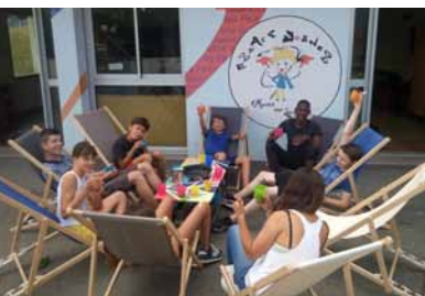
P.7 Les vacances à l'Espace Jeunes