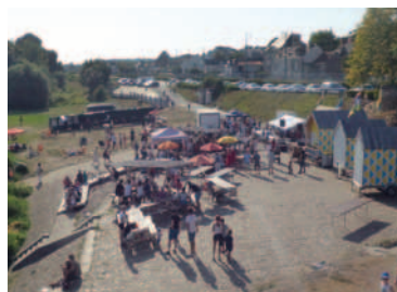
P.8 Rencontre Marinière