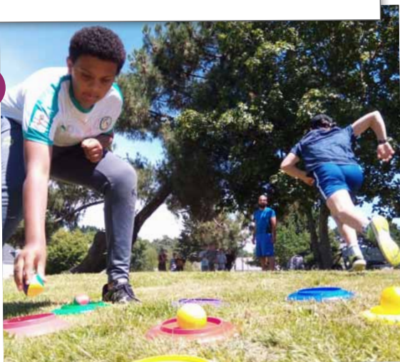
Durant l'été, le service enfance/jeunesse a proposé de nombreuses activités aux jeunes Malviens ainsi que des mini-séjours. L'objectif : profiter de l'été tout en respectant les mesures sanitaires.