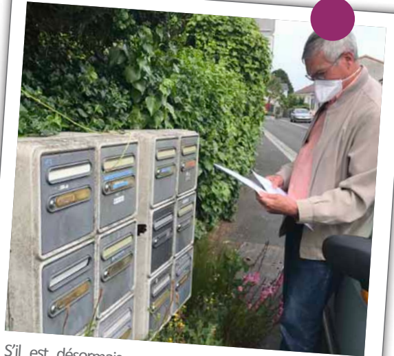
S'il est désormais un outil indispensable de la vie quotidienne, tout le monde n'était pas équipé de masques lors du déconfinement. Les élus ont ainsi parcouru la Commune pour en distribuer à chaque habitant.