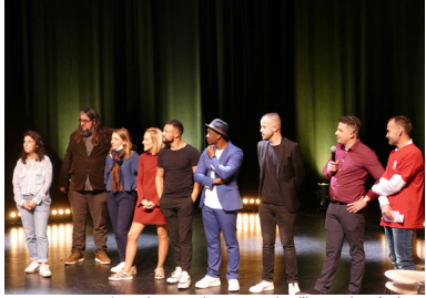
Les artistes du Tremplin au complet, l'heure des résultats