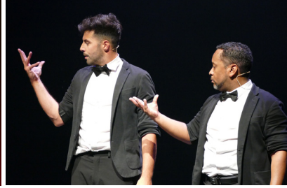
Synchronisation des Vice Versa