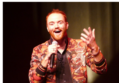
P.14_ Mauves de Rire 2021