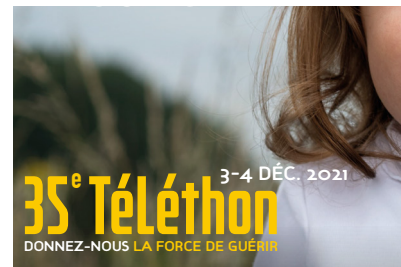
P.16_ Le Téléthon 2021 : c'est parti !