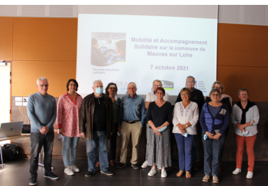
P.6_ MSM : Mobilité Solidaire à Mauves !