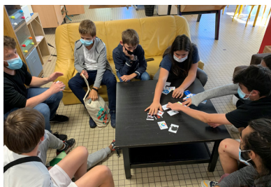
P.7_ Les activités de l'Espace Jeunes