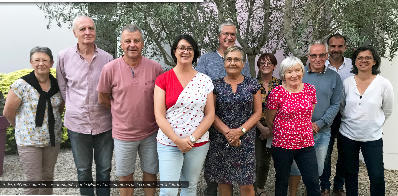
5 des référents quartiers accompagnés par le Maire et des membres de la commission Solidarité.