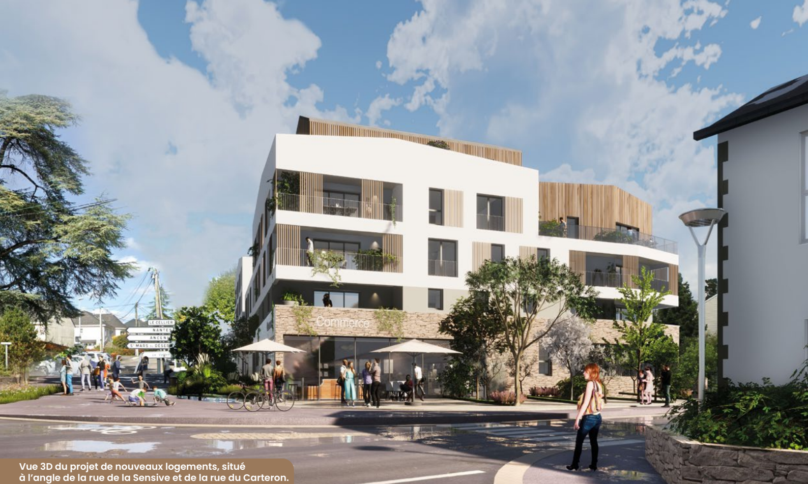
Vue 3D du projet de nouveaux logements, situé à l'angle de la rue de la Sensive et de la rue du Carteron.