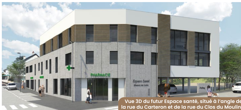
Vue 3D du futur Espace santé, situé à l'angle de la rue du Carteron et de la rue du Clos du Moulin.

Après les phases 1 (Rue de la Mairie et Rue du Carteron) et 2 (Rue du Cellier), la phase 3 (aménagement de la place de l'Eglise) tarde à démarrer... En cause,