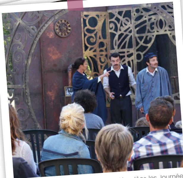
Dimanche 18 septembre se sont déroulées les Journées Européennes du Patrimoine, dans la cour du château de la Droitière, où la municipalité avait convié la compagnie La « Pioche » pour son spectacle d'improvisation autour des voyages de Jules Verne : « Vaste Monde ».