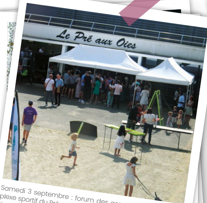
Samedi 3 septembre : forum des associations du complexe sportif du Pré aux Oies, avec plus de trente associations. Véritable succès avec des centaines de personnes venues découvrir la diversité et le dynamisme des associations malviennes. Une belle occasion de présenter la commune aux nouveaux arrivants qui, à cette occasion étaient accueillis par Monsieur Le Maire et son équipe.