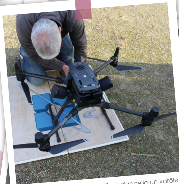
Ce drôle d'engin à quatre hélices s'appelle un « drôle ». Euh, pardon : un « drone ». Rien de drôle, c'est même très sérieux. Mardi 27 septembre, l'entreprise AED (Atlantique Expertise Drones) est intervenue pour réaliser des inspections, en vol et filmées, des toitures des principaux bâtiments communaux, afin de déceler ou anticiper des défauts d'usure.