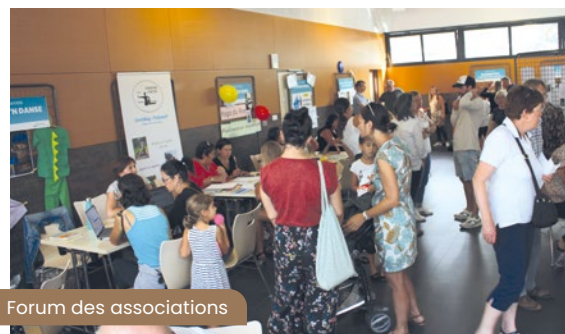
Forum des associations