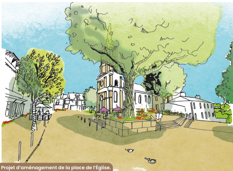
Projet d'aménagement de la place de l'Église.