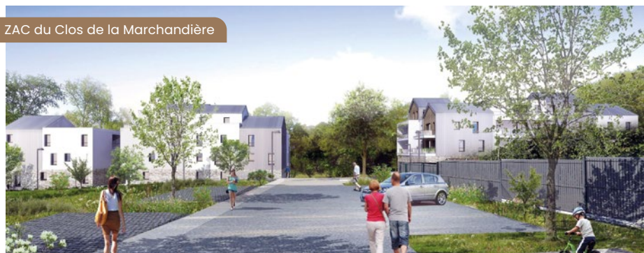
ZAC du Clos de la Marchandière

Après les programmes Haute-Rive et Clos du Prieuré, issus de l'OAP Jacques Prévert (Orientation architecturale et paysagère), un premier projet devrait voir le jour à l'horizon 2027 dans le périmètre, cette fois, de l'OAP Centre-Bourg. Celui-ci s'inscrit dans le cadre du transfert programmé de la pharmacie dans le futur Espace Santé. Entre la place Charles de Gaulle et la rue du Clos du Moulin, 2 collectifs de 27 et 23 logements (respectivement en R+3+attique et R+2+attique), dont 13 sociaux, verront leurs travaux débuter une fois la pharmacie transférée (a priori début 2025) pour une livraison probable début 2027.