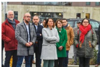
P.6 CONTRAT TERRITORIAL