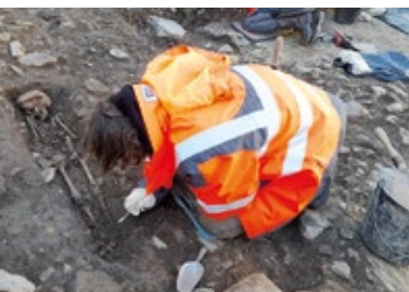
P4. FOUILLES ARCHÉOLOGIQUES