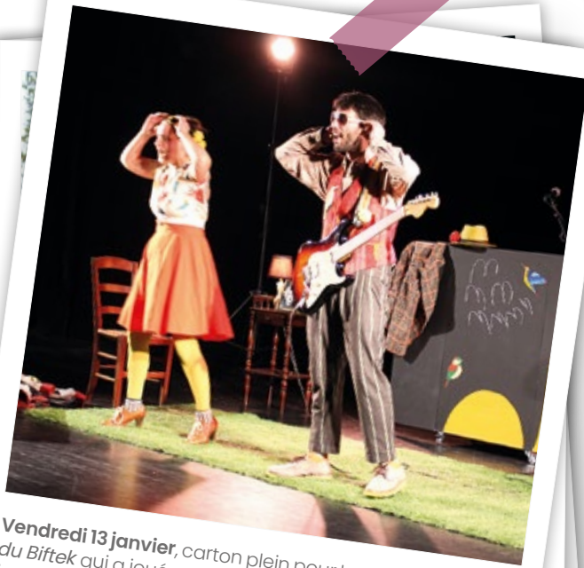
Vendredi 13 janvier , carton plein pour la troupe Les Arêtes du Bifteck qui a joué sa dernière création « Spectacle pour jouer à tue-tête et à cloche-pied ». L'ambiance était au rendez-vous et le public - petits et grands - comblé. Ce spectacle faisait suite à une résidence au Vallon.