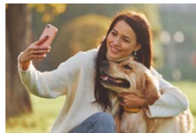
P17. CONCOURS PHOTO 2023