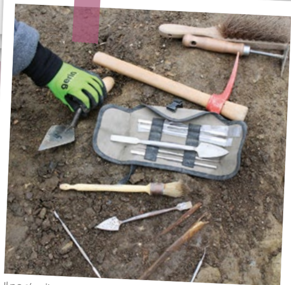
Il ne s'agit pas d'une trousse chirurgicale, ni des pinces et palettes d'un artiste peintre... C'est tout l'attirail que possède chacun des archéologues présents sur le chantier de fouilles de la place de l'Église.