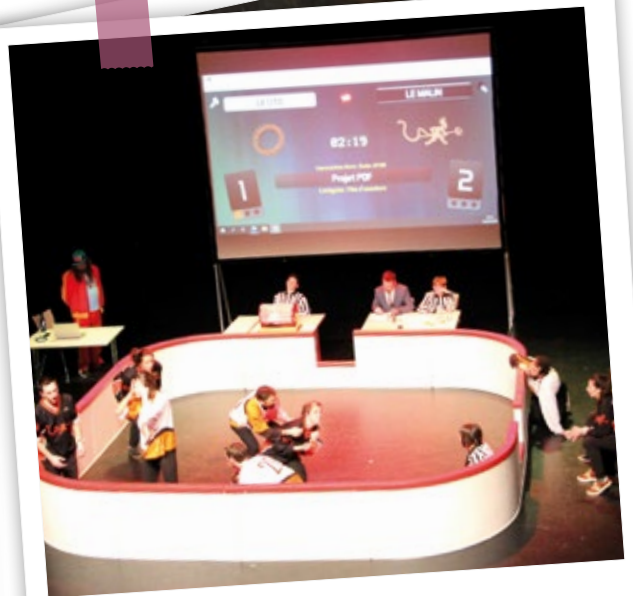
Vendredi 3 février. Bravo aux ados de l'Espace Jeunes qui ont organisé leur deuxième match d'impro au Vallon, également à guichet fermé ! Les deux équipes invitées sont maintenant à égalité, une troisième édition s'impose...